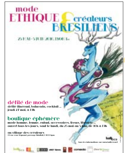
Affiche du festival 2010

o Newsletter mensuelle diffuser auprès de 2000 contacts